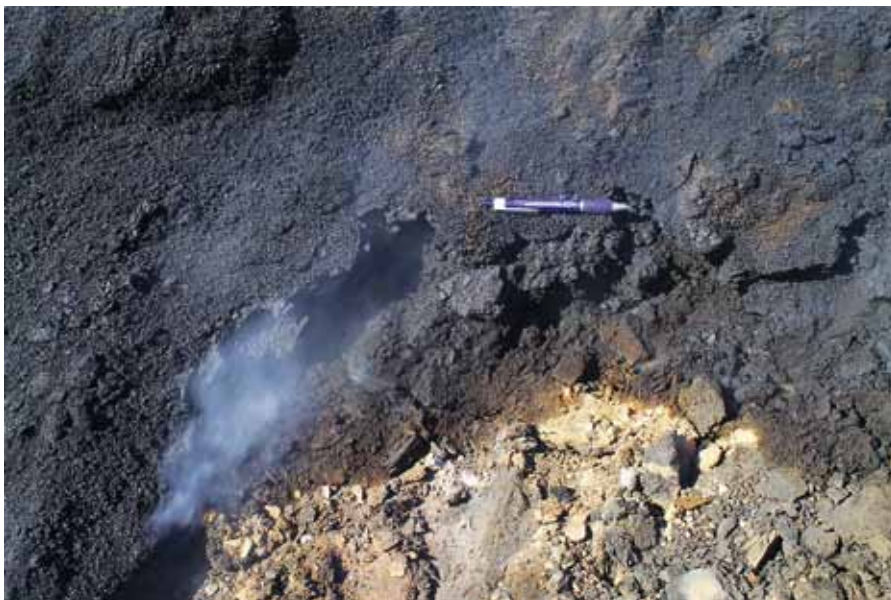
Рис. 3. Продукты пиролиза, выносимые из фумарольных каналов

Согласно результатам лабораторных исследований, смолянистое вещество представляет собой сжиженную пластичную массу (мезофазу). По данным Б.Н. Кузнецова [17], в условиях лабораторного пиролизного процесса образование пластичной массы (мезофазы) происходит в результате термического прокалывания угля при температуре выше 300°C. Дальнейшее повышение температуры приводит к выделению высокомолекулярных соединений ароматической природы,