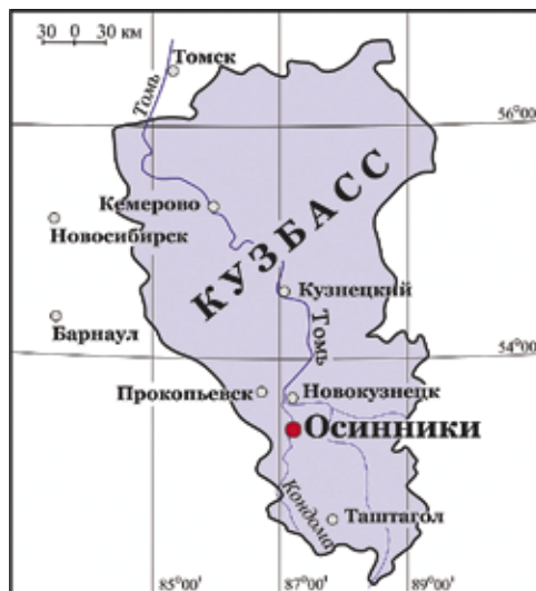
Рис. 1. Схематическая карта района исследований Fig. 1. Schematic map of the surveyed area

Горящий террикон Os-1 расположен на северной окраине г. Осинники (GPS = N53°37.746' E087°21.917').