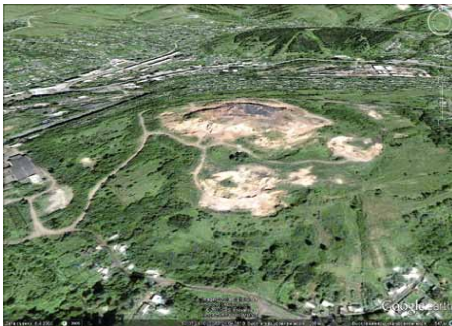
Рис. 2. Космоснимок общего вида террикона Os-2 в г. Осинники Fig. 2. Satellite image of the overall view of the Os-2 waste dump in the town of Osinniki

Большой экологический вред наносят и «пассивно» дымящиеся на некоторых терриконах фумаролы. Их деятельность исследовалась на относительно высоком (около 32 м) и большом (эллипсовидное основание размером 257 × 367 м) терриконе Os-2 (GPS = N53°37.528' E087°22.562') (рис. 2).