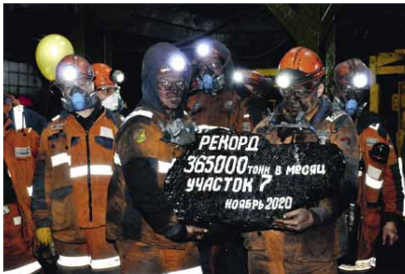
Рекорд месячной добычи на шахте «Воргашорская», ноябрь 2020 г.

Также компания приобрела добычный комплекс на сумму более одного миллиарда рублей. Оборудование будет установлено на шахте «Комсомольская». В тендере участвовали более 20 компаний из разных стран, включая Великобританию, страны Европы и Китай. В процессе определения поставщика была задействована большая команда профессионалов. В результате отечественная компания «Анжеромаш» поставит забойно-транспортный комплекс. В него входит лавный конвейер и скребковый перегружатель. Ленточные конвейеры изготовит фирма «АКОНИТ» (Россия). Очистной комбайн 450E будет чешского производства от компании T Machinery a.s.. Гидравлические секции будут производства VMJ (Китай). За изготовление и поставку системы электрогидравлического управления секциями возьмется компания MARCO (Германия). Несмотря на то, что все оборудование будет от разных производителей, оно будет между собой хорошо комбинироваться, что гарантирует его отличную работу в комплексе.