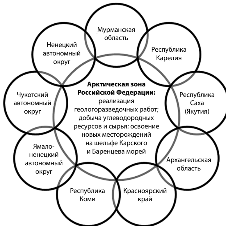
Рис. 1. Состав территорий горнопромышленного комплекса свободной экономической зоны АЗРФ [6]

Горнопромышленные территории Мурманской области обеспечивают реализацию приоритетных инвестиционных проектов, в основе которых лежит процесс возведения специализированной верфи для строительства крупнотоннажных морских сооружений и портов компании «Новатэк». При этом одним из ключевых мероприя-