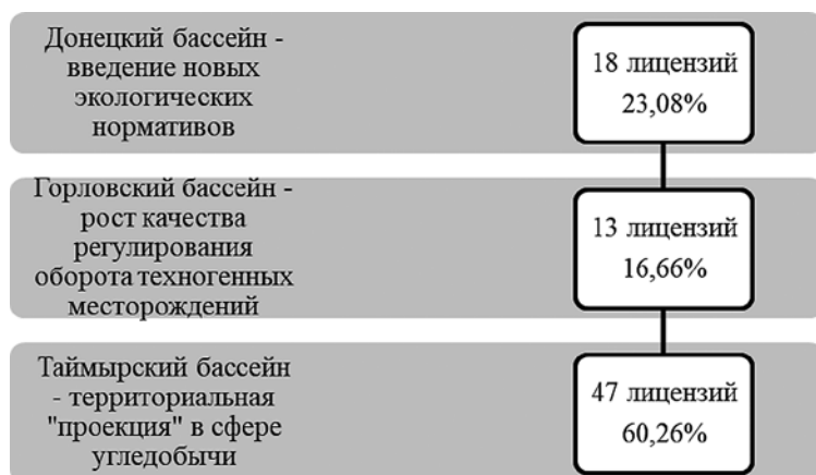
Рис. 2. Условия функционирования сегмента угледобычи

Анализ тенденций в сегменте добычи полезных ископаемых [11] позволяет утверждать о наличии высокого удельного веса прибыльных компаний отрасли – 63,4%, а на долю убыточных приходится 36,6% [9]. При этом одна из ключевых задач развития горнопромышленного комплекса Арктической зоны России, способствующая маневрированию рисковыми решениями, заключается в поиске