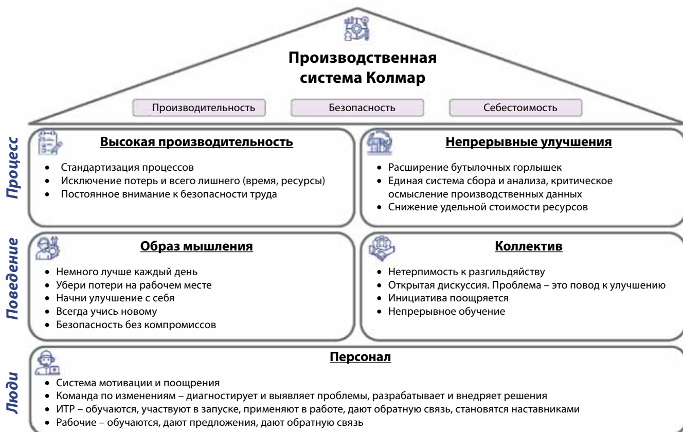
Рис. 2. Производственная система непрерывного улучшения ООО «УК «Колмар»